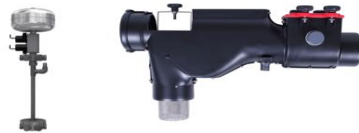
شکل ۲- پالایه اولیه و شاسی اصلی دستگاه (Zare Ghanat Novi 2018).

شاسی متصل می‌گردد. شاسی این پکیج قادر است تا شش غشا را روی خود جای دهد. لوله ورودی فاضلاب به پالایه اولیه که به این قطعه متصل است وصل می‌گردد. در داخل این قطعه آشغال‌گیر کوچکی تعبیه شده که مانع از ورود مو یا آشغال به داخل مخزن تصفیه می‌گردد. در صورتی که مخزن گنجایش کافی در دریافت فاضلاب را نداشته باشد، فاضلاب اضافی از انتهای این قطعه به‌صورت ثقلی خارج و به چاه جذب یا سایر منابع پذیرنده وارد می‌شود. در شکل (۲) سمت راست پالایه اولیه و سمت چپ شاسی اصلی را نشان داده شده است.