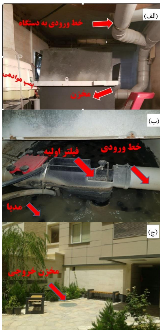
شکل ۱- اجزای آن سیستم بازچرخانی آب خاکستری: (الف) خط ورودی، (ب) مخزن ورودی، و (ج) مخزن خروجی (Zare Ghanat Novi 2018).

ورودی به دستگاه، مخزن سیستم تصفیه و پمپ هوادهی نشان داده شده است. شکل (۱-ب) که بخش مخزن ورودی سیستم تصفیه می‌باشد نشان می‌دهد آب خاکستری وارد یک پکیج می‌شود که مخزن آن تقریباً معادل 4000 \text{ l} گنجایش دارد و درون این مخزن که از جنس فلزی با روکش اپوکسی است، یک دستگاه فیلتراسیون غشایی وجود دارد که این غشا توانایی حذف ویروس و باکتری را تا حد بالای ۹۹/۹۸٪ دارد و پس از آن پساب تصفیه‌شده وارد یک مخزن از جنس پلی پروپیلن در زیرزمین می‌شود.