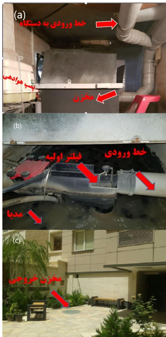
Fig. 1 Components of greywater treatment system: a) inlet pipe, b) inlet tank, and c) outlet tank (Zare Ghanat Novi 2018)

1439 and 1676 mg/l, respectively. The lowest and highest values of BOD 5 as one of the important biological indicators were 724 and 826 mg/l and the average BOD 5 of the samples was 786 mg/l. The average amount of nitrate in the input samples was 15395 mg/l and the mean values of total coliform and thermoformed coliform were 1734 and 799 MPN/100 ml, respectively.