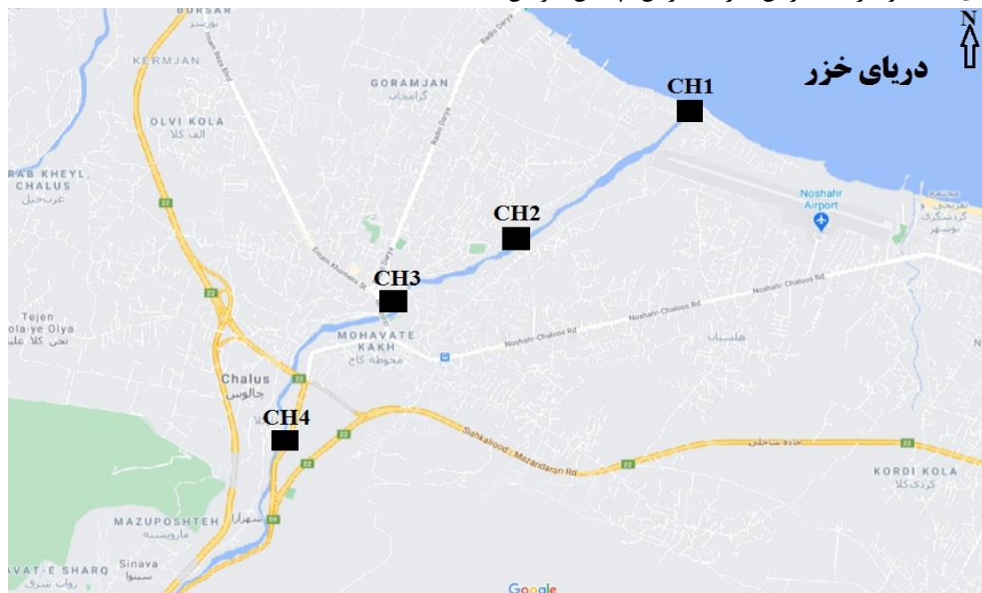
شکل ۱- محدوده مطالعاتی و موقعیت ایستگاه‌های نمونه‌برداری از رسوبات سطحی بستر رودخانه چالوس

رودخانه چالوس در طول جغرافیایی 39^\circ و 51^\circ و عرض جغرافیایی 27^\circ و 36' واقع شده است. طول رودخانه چالوس ۷۳ کیلومتر است. از آنجاکه رودخانه عموماً در کوهستان و دره‌های تنگ و باریک جریان دارد بنابراین چندان عریض