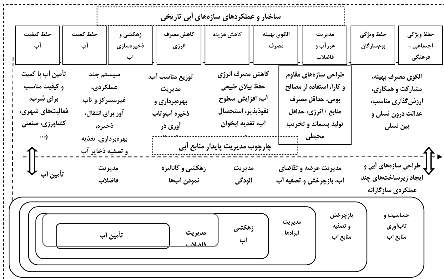
شکل ۲- مدل تطبیقی ساختار و عملکرد سازه‌های آبی تاریخی شهرهای کویری با چارچوب مدیریت پایدار منابع آب Fig. 2 Adaptive model of structure and function of historical water structures in desert cities with sustainable water resources management framework